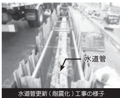
水道管更新(耐震化)工事の様子

お届けしていくためには、計画的な水道管の更新が欠かせません。 市では、これまでも古くなった水道管を計画的に更新してきました。その結果、断