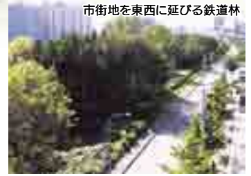
市街地を東西に延びる鉄道林