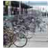
利用者の多い駐輪場