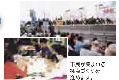
市民が集まれる拠点づくりを進めます。

また、商業施設集積事業、テナントミックス事業、商店街ファサード整備事業等を8丁目通街路事業と土地区画整理事業の進捗に合わせて実施していきます。