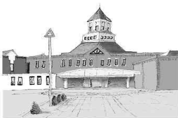
江別市セラミックアートセンター