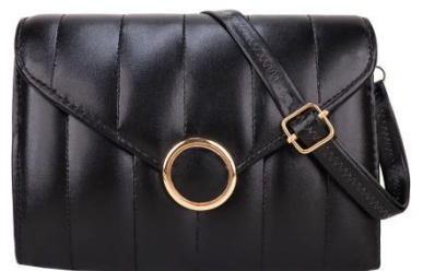
左:日本語で「ゴージャスなバッグ」を検索した結果