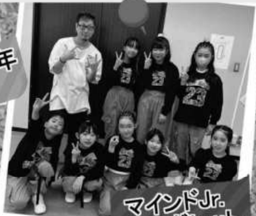
マインドJr. マーガレット