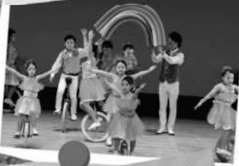
文京台一輪車クラブ