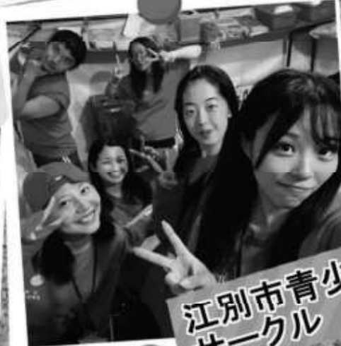
江別市青少年 サークル