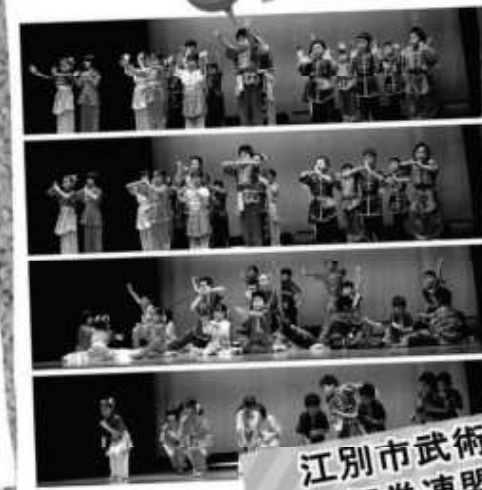
江別市武術 太極拳連盟