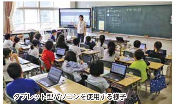
タブレット型パソコンを使用する様子