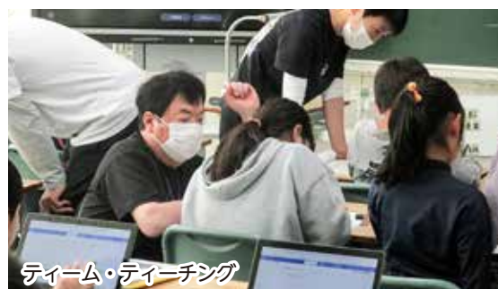
チーム・ティーチング