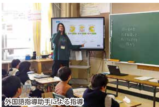
外国語指導助手による指導