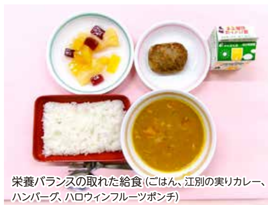
栄養バランスの取れた給食(ごはん、江別の実りカレー、ハンバーグ、ハロウィンフルーツポンチ)