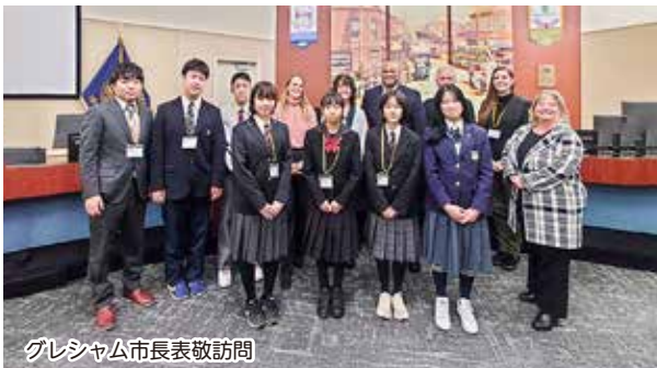
グレシャム市長表敬訪問

異なる文化に対する理解の促進や、社会性を育むため、姉妹都市・友好都市との相互交流事業を実施し、体験入学やホームステイを行います。