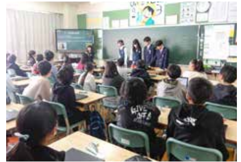
「小学6年生の中学校体験登校」及び「小中合同授業」の様子 (中学校の学習や生活について小学生に説明をする中学生)