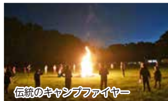
伝統のキャンプファイヤー

自然豊かな環境の中で、高校生や大学生のリーダーとともに過ごす、子どもたちだけのキャンプは江別市でしか体験することのできない江別市独自の行事です。