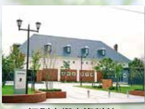
江別市郷土資料館