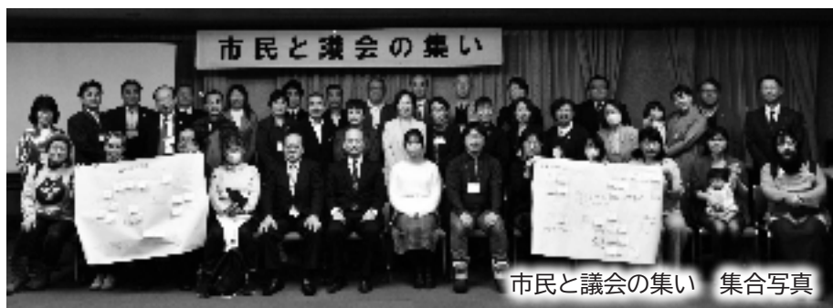
市民と議会の集い 集合写真

また、11月には市民と議会 の集いを開催し、幅広い世代 の皆さまと、江別市の子育て 環境に関することや市政全般 についてさまざまな意見を交 換することができ、実りある 時間となりました。