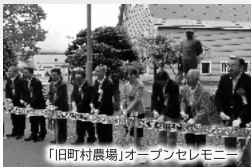
「旧町村農場」オープンセレモニー

新年あけましておめでとう ございます。 市民の皆さまには、ご家族 とともに健やかに新年をお迎 えのことと心からお喜び申し 上げます。また、市政各般に 深いご理解と温かいご支援 ご協力を賜り厚くお礼申し上 げます。 振り返りますと、昨年は市 制施行70周年を迎え、市民の 皆さまとともに、スポーツや 文化などさまざまな周年イベ ントの開催を通じ、節目の年 を祝うことができました。 また、6月には北海道の略 農史を示す歴史的建造物であ る「旧町村農場」が、カフェ やキッズスペースを併設した 子どもから大人まで誰もが親 しみやすい施設としてリニユ