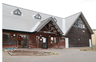
市が開設する放課後児童クラブの一つ、森の子児童クラブ(文京台7-4)。

市内に27カ所ある放課後児童クラブは、小学生を対象に、保護者または保護者に準ずる方が、昼間仕事などのため家庭にいない場合や病気などで昼間に面倒を見ることができない場合に、申請をすることで利用できます。令和7年度には新たに3カ所開設される予定です。