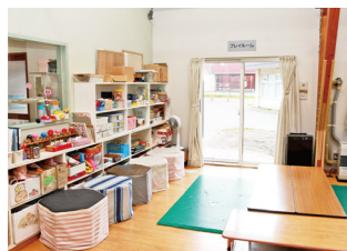
本を読んだり、カードゲームやボードゲームなどで遊べたりするほか、パドミントンやボール遊びなどで体を動かすこともできます。

幼児から高校生までのさまざまな年齢の子どもたちが自由に遊ぶことができる児童センターが、市内に7カ所あります。各児童センターには遊びをサポートする児童厚生員が常駐しています。