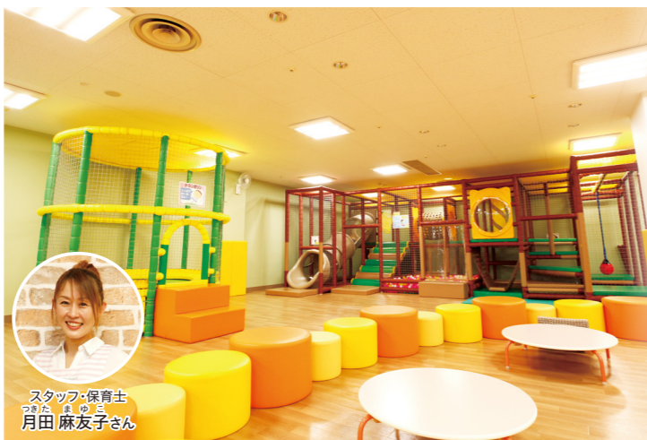
スタッフ・保育士 つたあいの 月田 麻友子さん

赤ちゃんエリア、2〜3歳エリア、4歳以上エリアと区分けして安全に楽しく遊べるよう配慮されています。