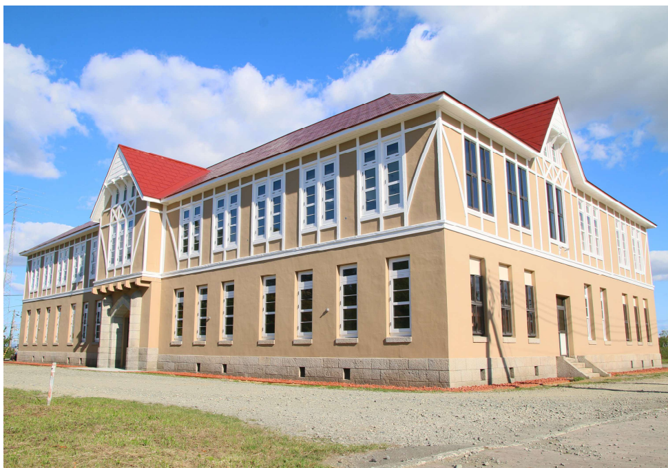
北海道林木育種場旧庁舎（登録有形文化財）