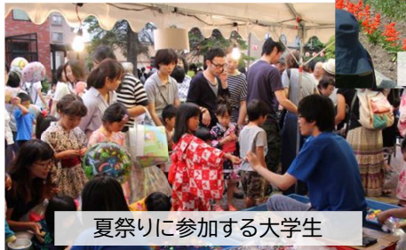
夏祭りに参加する大学生