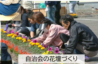
自治会の花壇づくり