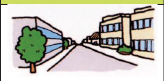
第一種中高層住居専用地域

中高層住宅の良好な環境を守るための地域です。病院、大学、500㎡までの一定の店舗などが建てられます。