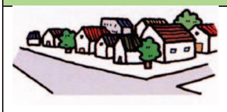
第一種低層住居専用地域

低層住宅の良好な環境を守るための地域です。小規模な店舗や事務所をかねた住宅や小中学校などが建てられます。