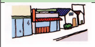
第二種低層住居専用地域

主に低層住宅の良好な環境を守るための地域です。小中学校などのほか、150㎡までの一定の店舗などが建てられます。