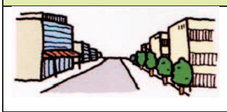
第二種中高層住居専用地域

主に中高層住宅の良好な環境を守るための地域です。病院、大学などのほか、1,500㎡までの一定の店舗や事務所など必要な利便施設が建てられます。