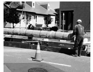
▲ 基幹管路耐震化事業