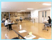
保健センターにて 開催(11月)