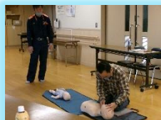
小児救命救急で実 技も学びます

とても良いしくみなので、もっと たくさんの方が受講して「子育て のお手伝い」ができる人の輪が 広がるといいですね～と受講 者からも声が聞かれました。