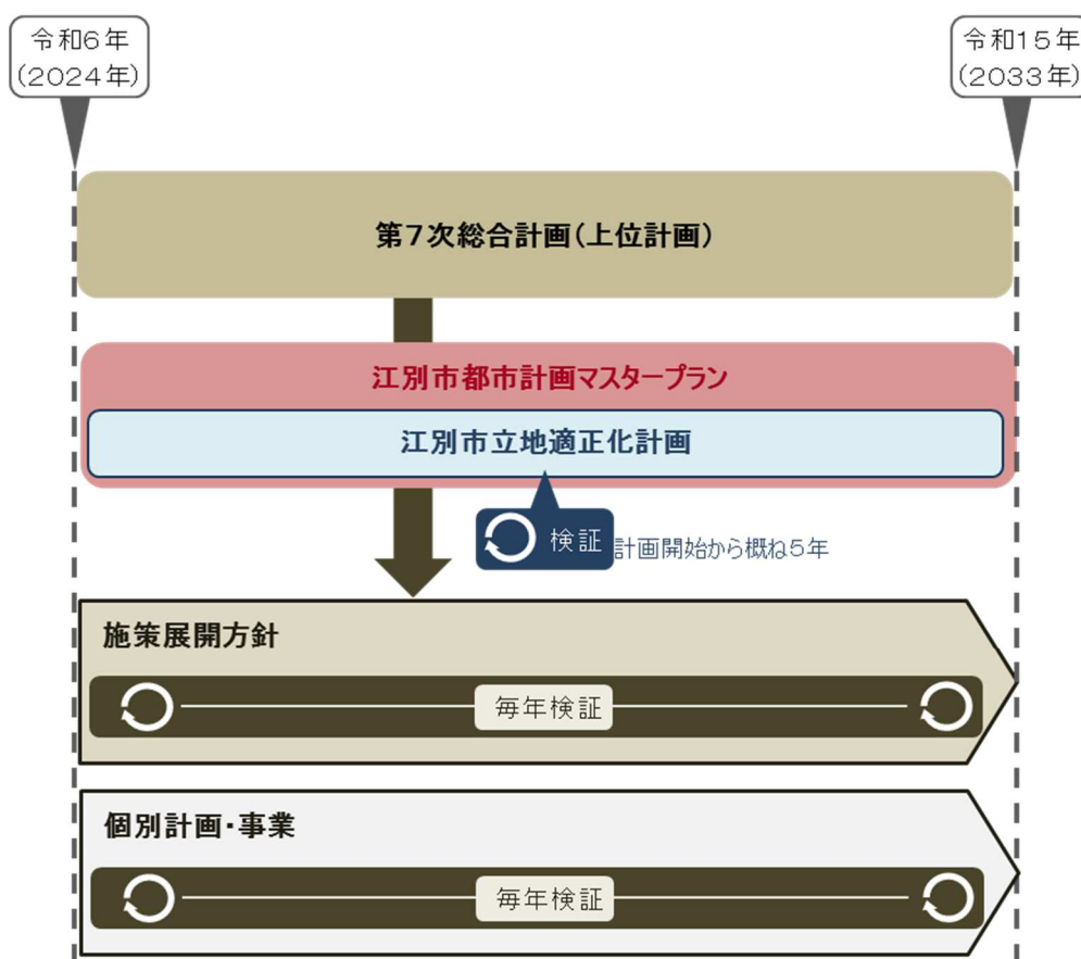
図 6-2 取組進捗状況の検証

また、本計画の一部とされる立地適正化計画においては、本計画におけるコンパクトなまちづくりの実践を担う計画として、概ね5年を目途に検証を行います。