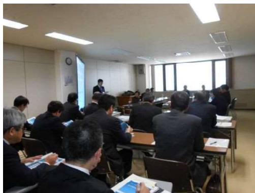
写真 9-1 【上下水道運営検討委員会の様子】