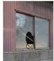
窓が割れた管理不全空家