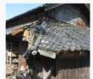
緊急代執行を要する崩落しかけた屋根