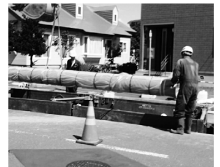
▲ 基幹管路耐震化事業