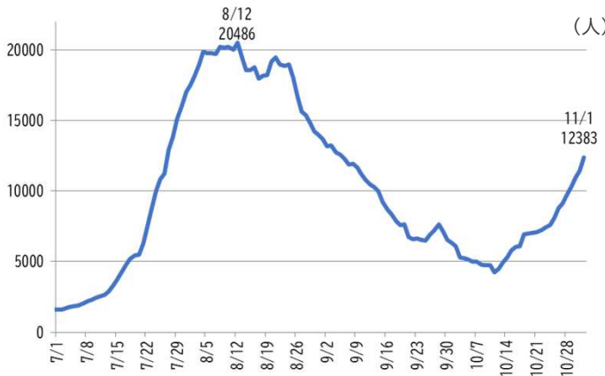
週当たりの新規感染者数