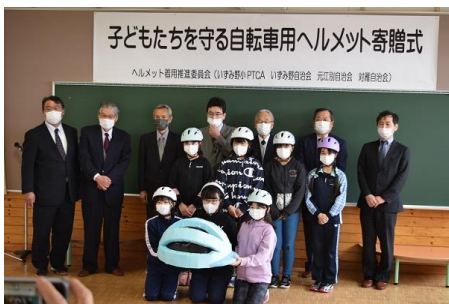
ヘルメット着用推進