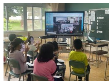
ふれあいmeet 〈特別支援学級〉