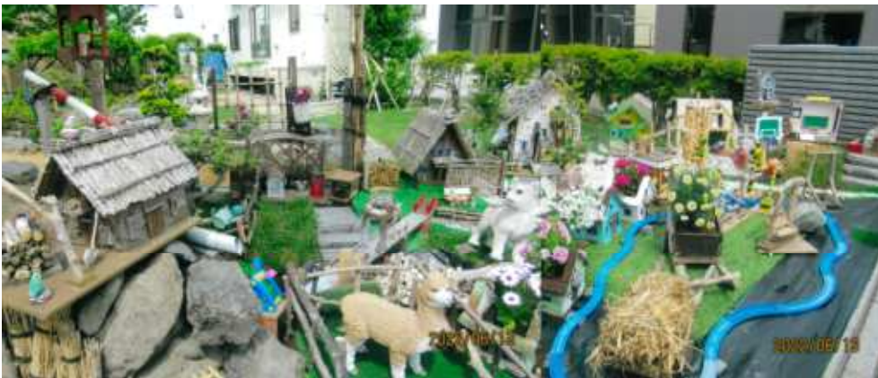
(2019年のミニチュアガーデン)