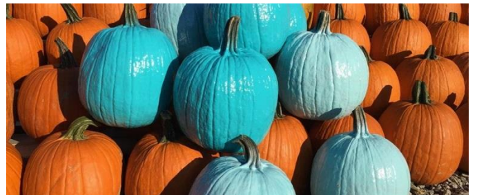
(青緑色のカボチャ)

らえるのを期待していたので、枕カバーをお菓子袋として使いました。故郷のシアトル市は、ハロウィンが非常に寒く、最低気温が0℃まで下がる時もあります。しかも、3人の小学生にとって20分歩くのは辛かったです。寒くて、疲れていて、文句ばかり言われていましたが、やっと坂を上りました。早速邸宅にピンポンしました。すると、ドアが開き、私達は「TRICK OR TREAT!」を叫びました。ドアに出たおばさんが「あれ?あなたたち大きすぎるんじゃないの?」と疑い、「まあ、いいや。どうぞ!」と言いながら、歯ブラシをくれました。ドアが閉まったら、3人の小学生が「なんだそりゃ!?お菓子じゃねえ!」とガッカリしました。次の家に行きましたが、今回はリンゴとバナナをもらいました。「そっか、お金持ちは私達貧乏の人と違い、健康を意識しているんだね」と気づきました。結局、フルサイズのお菓子は一本の板チョコしかもらえなくて、他は歯ブラシ、果物、レーズン、鉛筆や消しゴムに加えて、いつも通りの個包装のお菓子をもらいました。