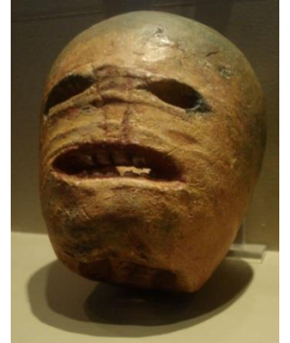
(カブでできた伝統的なジャック・オー・ランタンのレプリカ↑)

祭を毎年10月31日の夜から11月1日まで祝っていました。ゲール人は、サウィンに、異界との境界が開き、亡くなった親戚が家に戻り、妖怪や幽霊も現れると信じていました。悪霊を除けるために、くり抜いたカブやジャガイモでできた提灯を家の前に飾っていました。19世紀からアメリカに移住したアイルランド人やスコットランド人が野菜で提灯を作る文化も持ってきましたが、カブやジャガイモよりも、北米原産のカボチャの方がくり抜きやすかったので、現代のジャック・オー・ランタンが誕生しました。