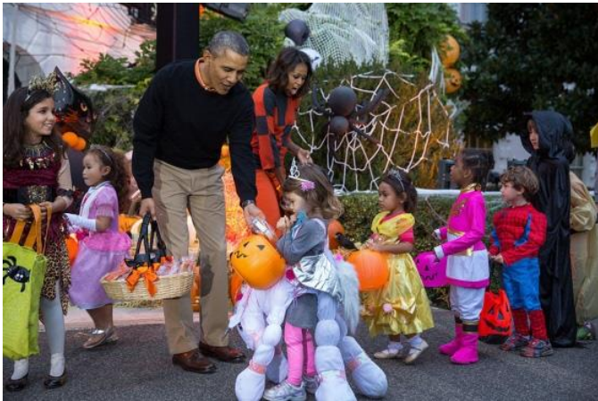
(ホワイトハウスでオバマ大統領とミシェル夫人がお菓子を配っている様子。大統領はどんなお菓子を配るのでしょうか?)

「トリック・オア・トリート」というのは、「お菓子をくれないと、いたずらしちゃうよ!」という意味で、子ども達の一番好きなハロウィンの行事です。まず、トリック・オア・トリートに行くには、仮装が必要です。吸血鬼、魔女、お化けなどの怖い仮装はもちろん人気ですが、かわいいキャラクターも人気あります。ちなみに、私が初めてトリック・オア・トリートに行った時は、バレリーナの仮装をして、兄は海賊の仮装をしました。夜になったら、トリック・オア・トリートが始まります。玄関に電気がついている家に行き、チャイムを鳴らし、ドアが開いた瞬間に「TRICK OR TREAT!」を叫びます。それで、お菓子がもらえます。