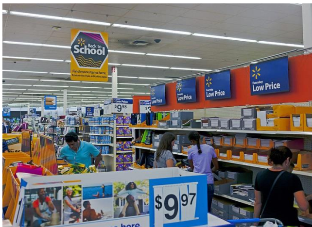
(Back to School Sale の様子)

まず、アメリカの学年は、9月からスタートして、6月に終わります。つまり、アメリカの生徒は約3か月の長い夏休みが楽しめます。日本の生徒は夏休みの間、大量の宿題をしなければなりません。しかし、アメリカは、学校や学年によって違いますが、殆どありませんでした。私の経験では、高校に入ってから、普通コースではなく、レベルの高い勉強ができる生徒向けのコースだったので、夏休みの宿題は少しありましたが、小説を読み、感想文を書くことくらいでした。普通コースの生徒は宿題がありませんでした。