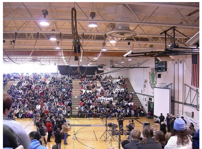
(私の高校の Martin Luther King Day 全校集会)

を利用し、新学年に必要な文房具や洋服を買いに行きます。場所によっては、学校の資金が不足しているので、最近先生が保護者にクラスの生徒全員で共用するために文房具や教材を購入するようにお願いしています。