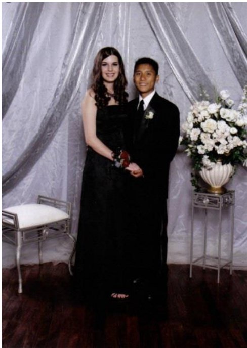
(私の Senior Prom。男子はただの友達)

日本の中2まで、高校(high school)は9年生(9 th grade、日本の中3)から12年生(12 th grade、日本の高3)までです。つまり、6年・3年・4年で、合計13年アメリカ人は学校に通っています。高校の学年には特別な呼び方があります。高校1年から4年までそれぞれ freshman(フレッシュマン), sophomore(ソフオモア), junior(ジュニア), senior(シニア)と言います。大学も同じ言い方です。