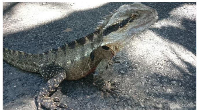
(オーストラリアの動物: ↑ Possum ↓ Frillneck Lizard)