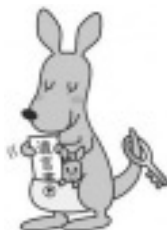
「遺言書ほかんガルー」

タートしてから1年が経過しました。遺言の方式には主に、公証人が関与して遺言書を作成し公証役場に保管する公正証書遺言と、自分で書いて自分で保管する自筆証書遺言があります。自筆証書遺言が遺言者の死亡後に発見されない、書き換えられてしまったなど「保管」についての問題を防ぐための制度です。詳しくは法務省のホームページをご覧ください。詳細：札幌法務局 民事行政部 供託課 ☎️ 709-2311 (内線 2172)