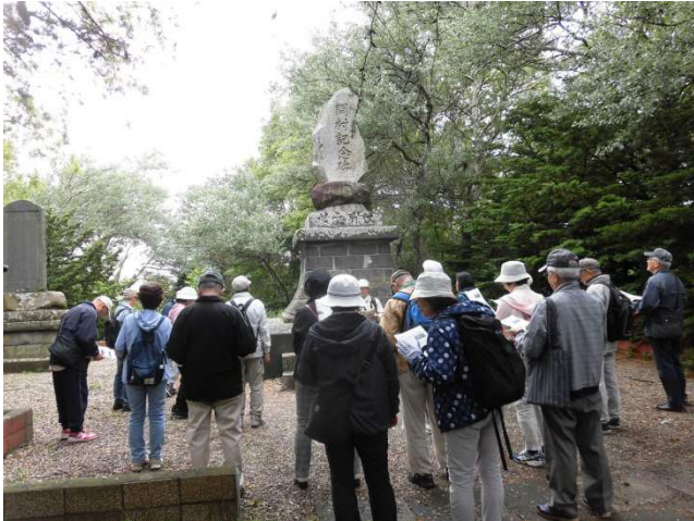
飛鳥山公園・江別兵村開村記念

内容 飛鳥山公園やモシヨッケ川跡、四季の道、旧町村農場、木製戦闘機キ106誘導路跡などを散策し、現在と当時の様子を比較しながら、明治期の開拓から昭和期、現在までのまちの移り変わりについて学び、この地区の歴史について理解を深めた。