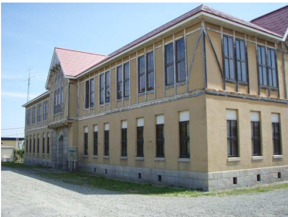
北海道林木育種場旧庁舎

日時 平成29年9月3日(日)13:00～16:30 講師 郷土資料館職員 参加者 42名 内容 野幌地区にある七丁目沢6遺跡、大麻地区にある 大麻1, 3, 5, 6, 13遺跡などをバスで見学し、縄文時 代の江別の様子について学んだ。また、昭和初期に建設さ れた北海道林木育種場旧庁舎も訪れ、建物の歴史や「ハー フテンパー」等の特色ある工法などについて学んだ。