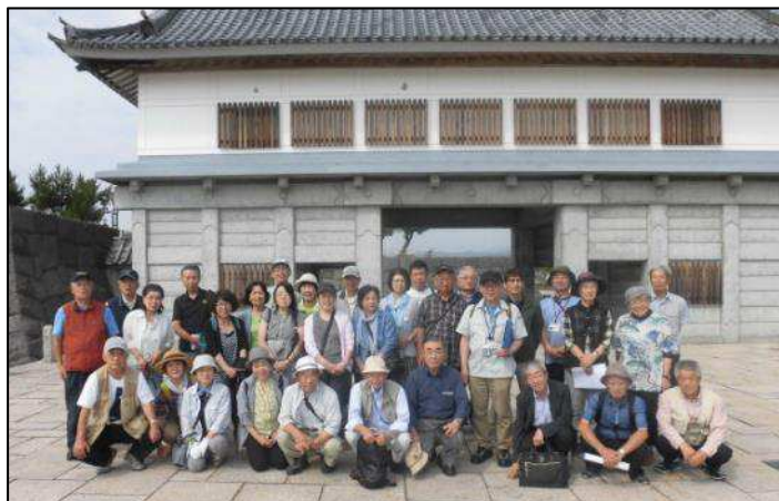
令和元年度友の会研修旅行 (だて歴史文化ミュージアム)