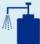
手洗い・手指消毒