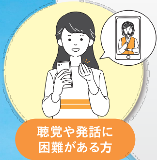
聴覚や発話に 困難がある方