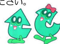
くるちゃん りんちゃん 環境クリーンセンターキャラクター