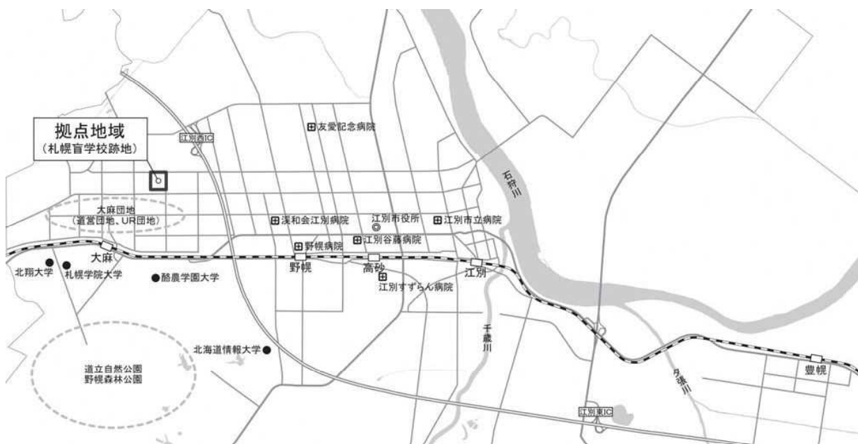
【図3】本計画の対象区域

4つの大学のうち、酪農学園大学、北翔大学、札幌学院大学の3校が大麻地区に、北海道情報大学が野幌地区に立地しています。