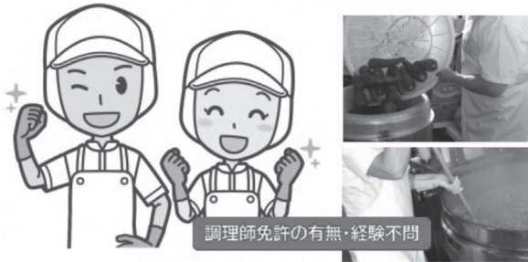
調理師免許の有無・経験不問