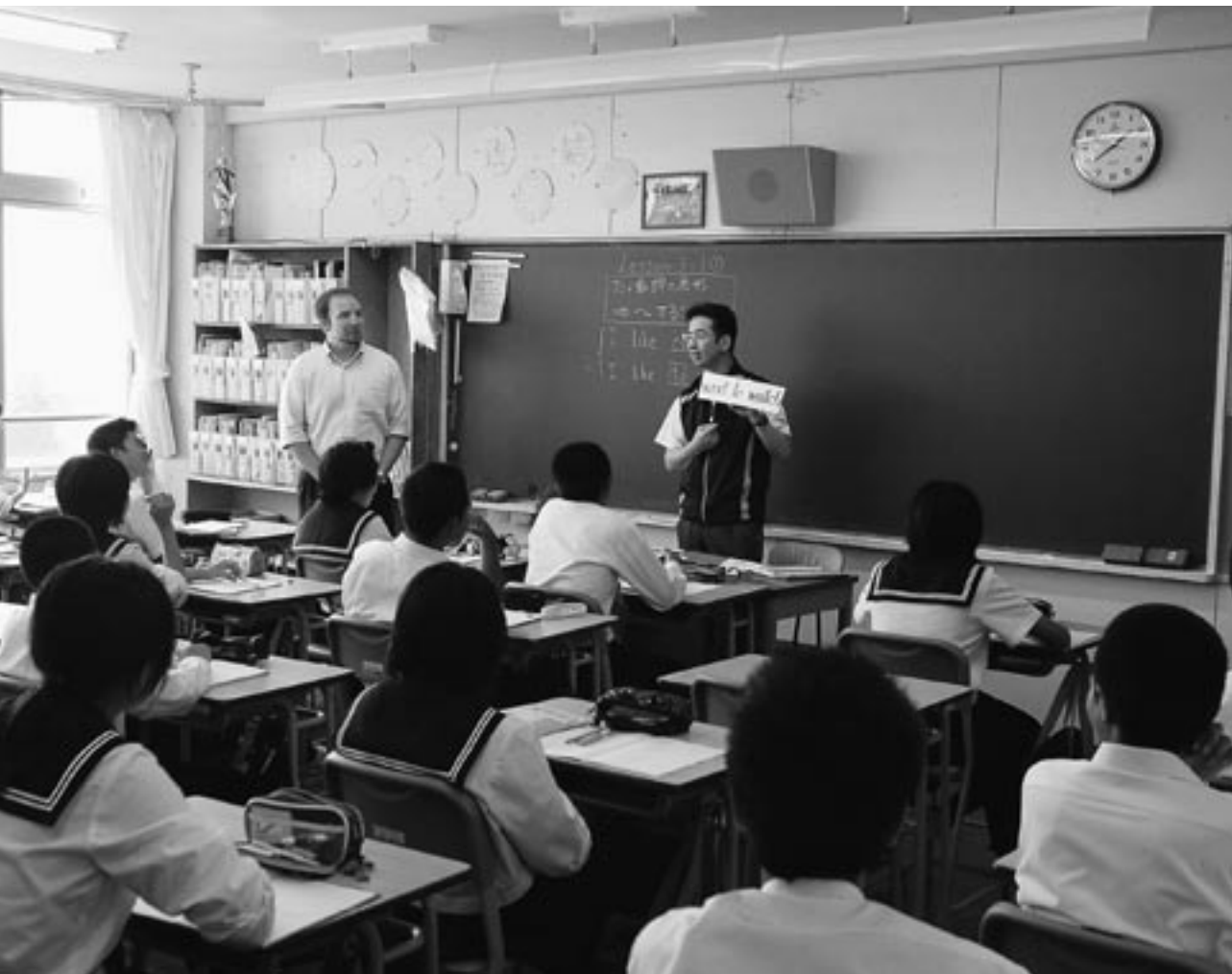
市内中学校における英語の授業風景 ～レッツ・イングリッシュ外国青年招致事業～

発行 江別市議会 江別市高砂町6番地 電話011(381)1051 編集 市議会報編集委員会 印刷 株式会社須田製版