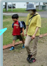
Kさんと提供会員Kさん 学校にお迎え後預かり