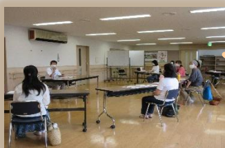
提供会員活動前研修 感染対策をとった上で実施