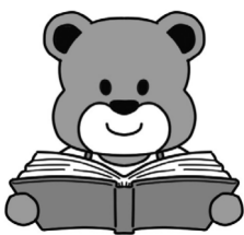
情報図書館 イメージキャラクター 「ほんた」

●ワークシヨップ 「防災・減災のはなし」 防災についての講話と段ボールベッド組み立てを行います。 9月12日(出)11時~12時 2階ビデオ視聴室 対 ワークシヨップは先着20名(申込不要)