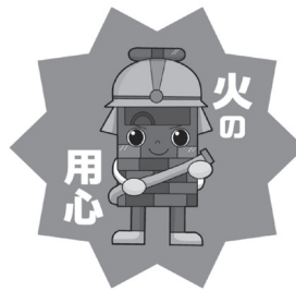
消防公式キャラクター「ポーカくん」

と、市ホームページ 問 市民生活課 ☎381・1124 4月20日(月)～30日(木)は 春の全道火災予防運動 空気が乾燥し、火災が発生しやすい時季を迎えます。野火の原因になるたばこの投げ捨てやごみ焼きは絶対にやめましょう。