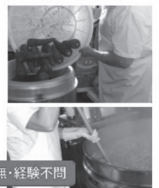
調理師免許の有無・経験不問