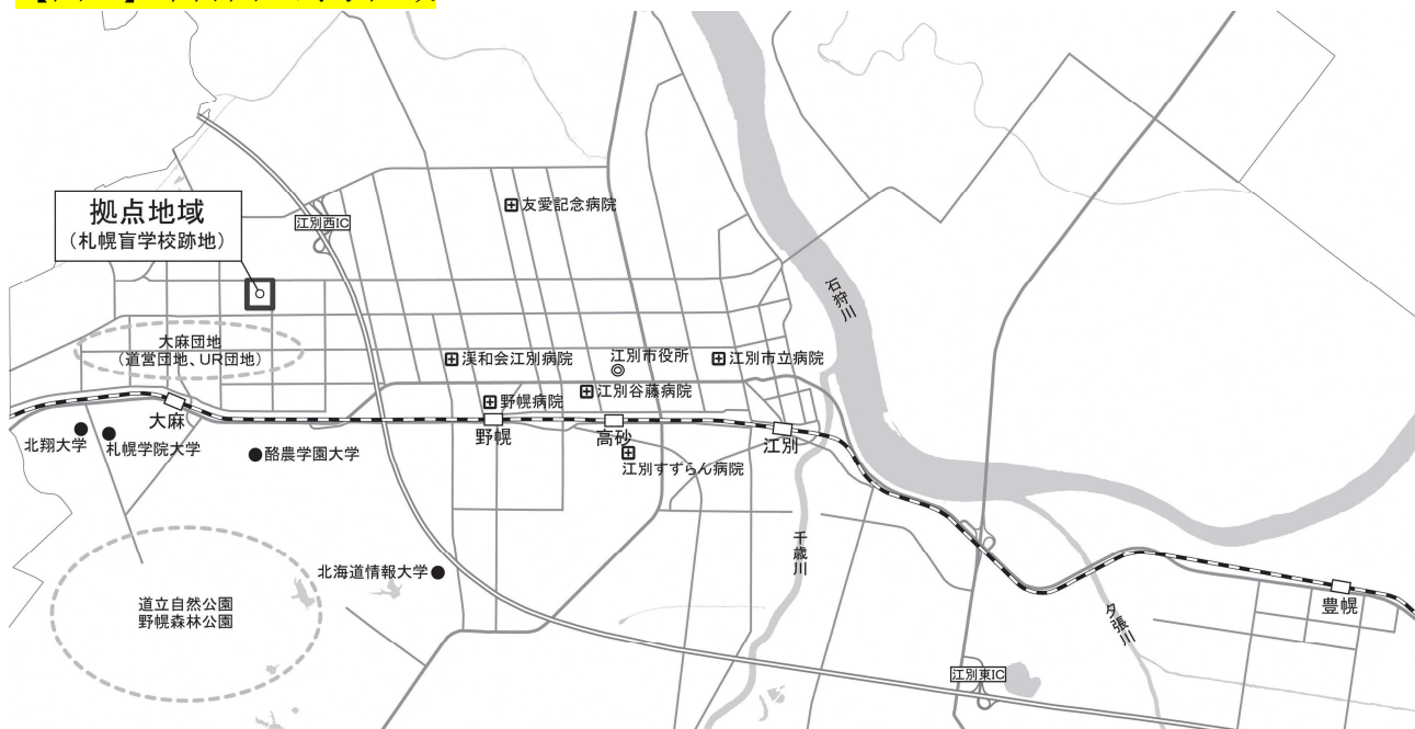
【図3】本計画の対象区域

4つの大学のうち、酪農学園大学、北翔大学、札幌学院大学の3校が大森地区に、北海道情報大学が野幌地区に立地しています。