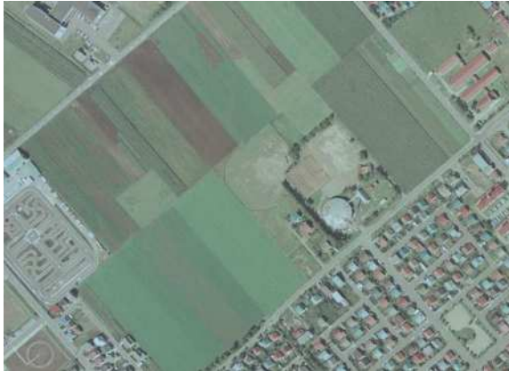
「国土地理院撮影の空中写真（1985年撮影）」

はやぶさ運動広場として活用を開始した当初は、施設周辺は広大な農地であり、子どもたちが伸び伸びとスポーツを楽しめる環境が整っていた。しかし近年は隣接地に大型商業施設や福祉関係施設、高層住宅、新興住宅地などが相次いで整備されてきており、飛球や騒音、砂ぼこり、駐車場など様々な面でのトラブル発生が懸念される状況となっている。