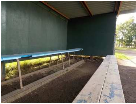
(三墨側ダッグアウト)