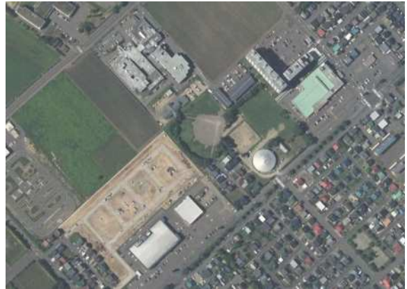
「国土地理院撮影の空中写真（2018年撮影）」