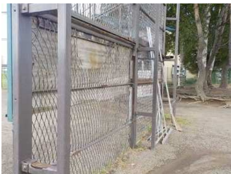
(バックネット一塁側破損部)