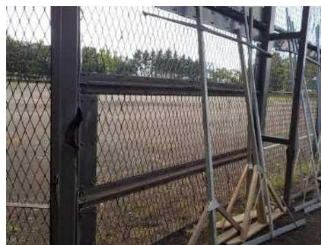
(バックネット腐食部)