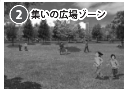
② 集いの広場ゾーン