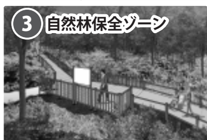
③ 自然林保全ゾーン