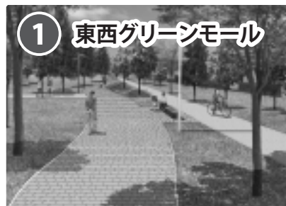
① 東西グリーンモール