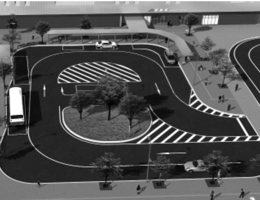
野幌駅前南口広場 完成イメージ