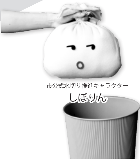
市公式水切り推進キャラクター