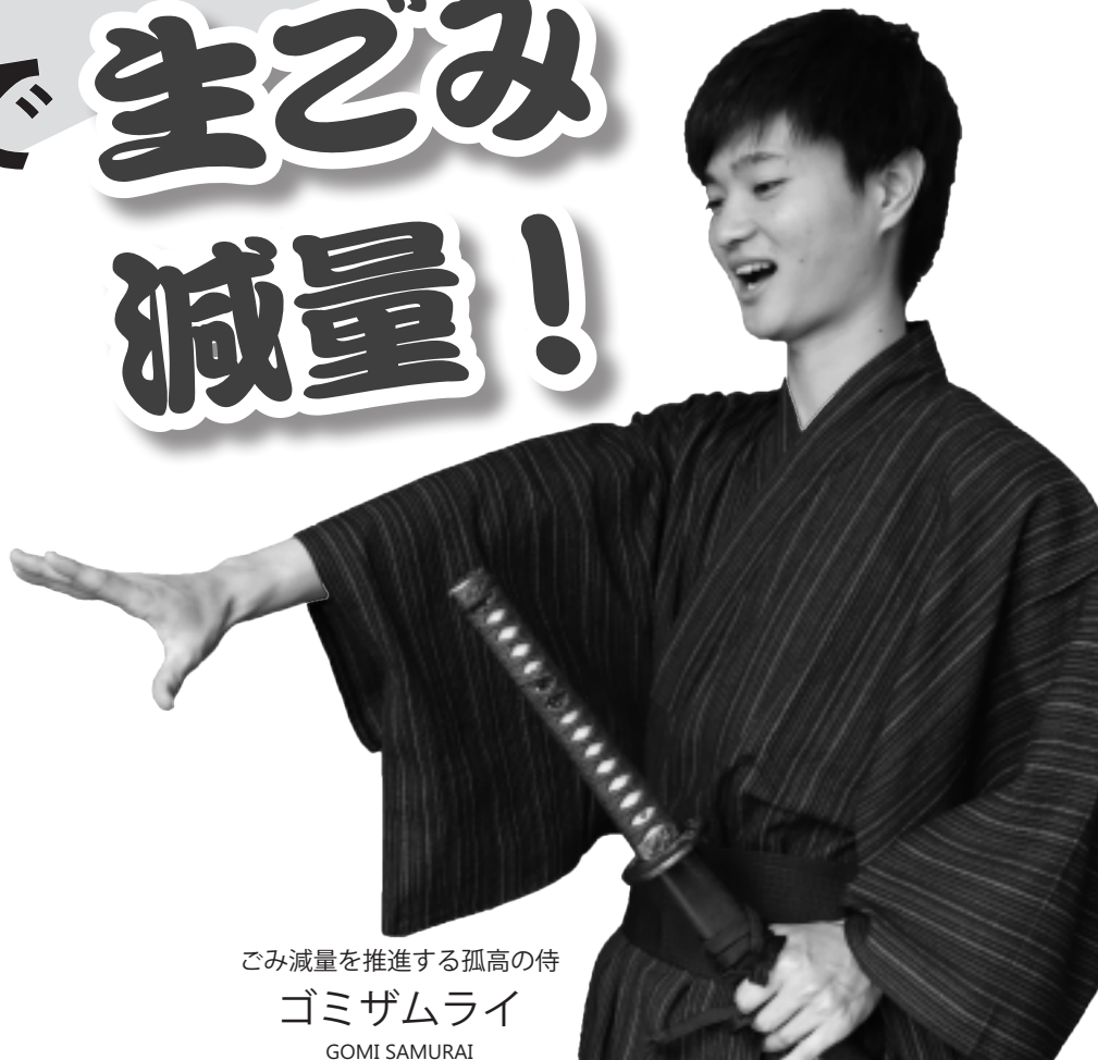
ごみ減量を推進する孤高の侍