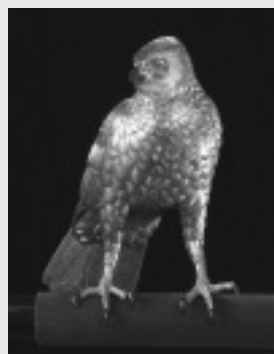
鈴木長吉《十二の鷹》 (東京国立近代美術館所蔵)

東京国立近代美術館工芸館の膨大な収蔵品の中から、陶芸・ガラス・漆工・竹工・染織・人形・金工の各分野を代表する珠玉の名品を展示します。