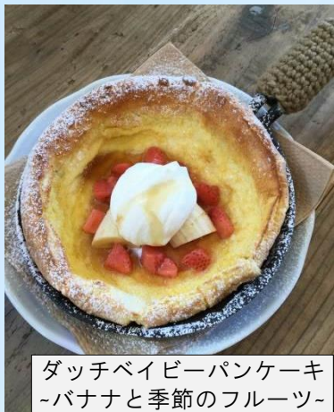
ダッチベイビーパンケーキ ~バナナと季節のフルーツ~