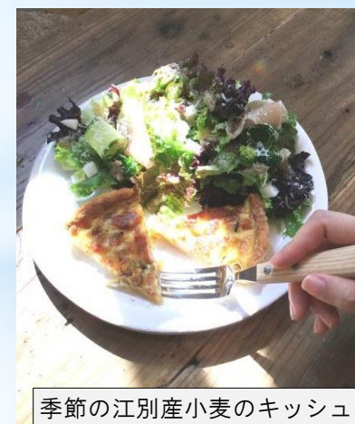
季節の江別産小麦のキッシュ

* 店舗URL https://www.facebook.com/bonvivant.ebetsu