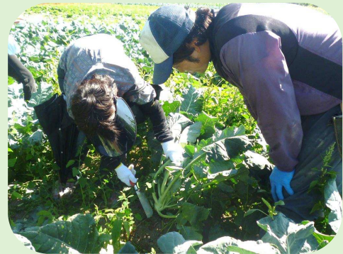
都市と農村交流事業 バスツアー（収穫体験）