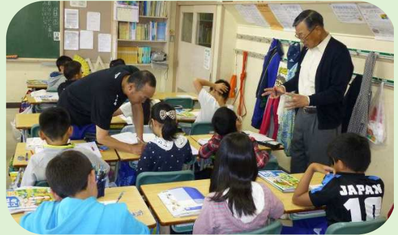
チームティーチング 大麻泉小