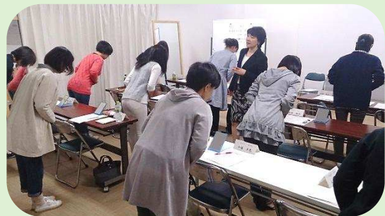
女性の就職支援 ビジネスマナー研修