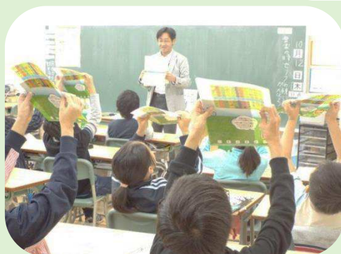
協働を知ってもらう啓発事業（出前講座）