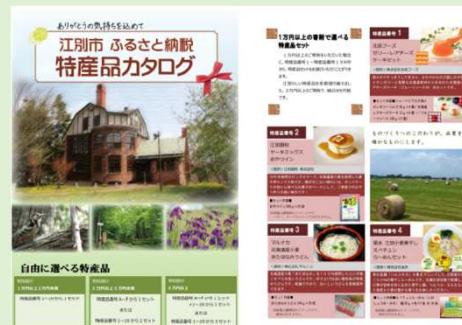
ふるさと納税「江別市特産品カタログ」