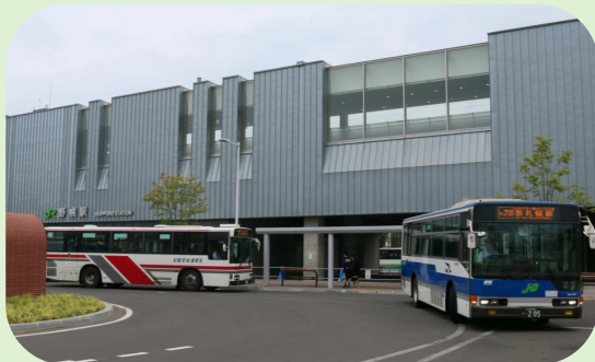
野幌駅北口バス停