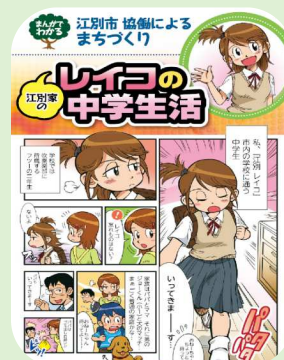
協働を知ってもらうパンフレット