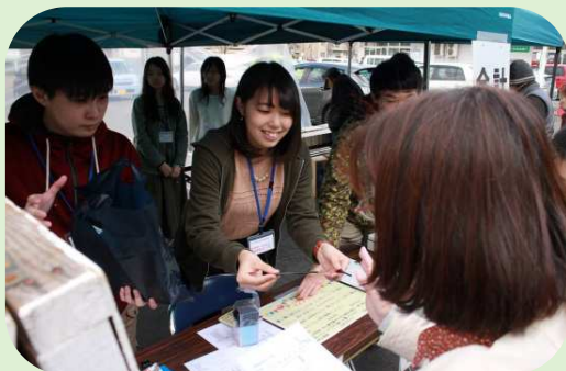
学生地域定着自治体連携事業（大麻銀座商店街）