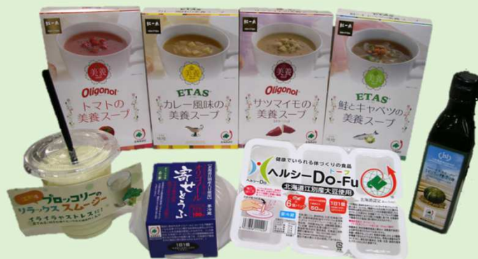
江別市内企業のヘルシーDo認定商品