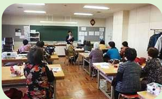
商店街参入促進セミナー