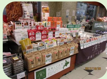
美味しい江別フェア