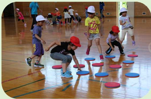
児童生徒体力向上事業 出前授業