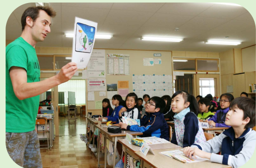
外国語指導助手による授業