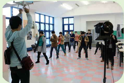
大学生による動画作成風景