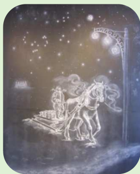
壁面黒板チョークアート