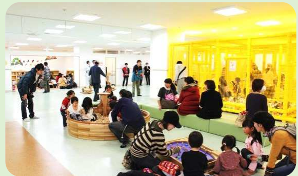
「ぼこ あ ぼこ」で遊ぶ親子