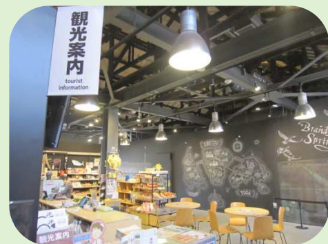
江別アンテナショップGET'S