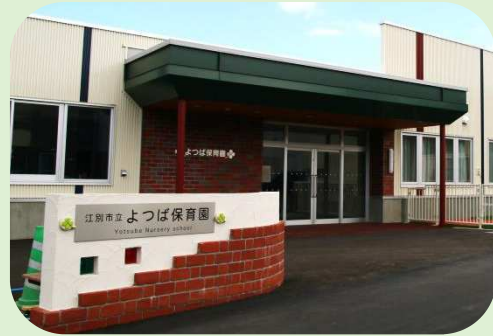
よつば保育園（平成28年11月開園）