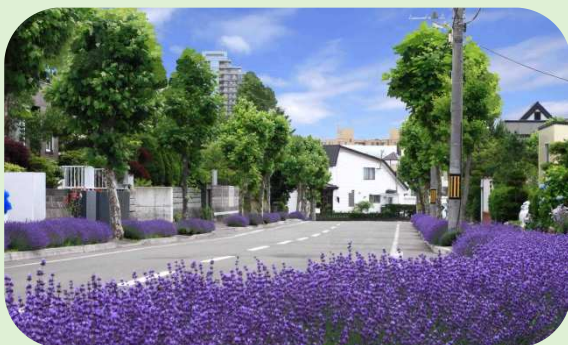
大麻地区 ラベンダーロード