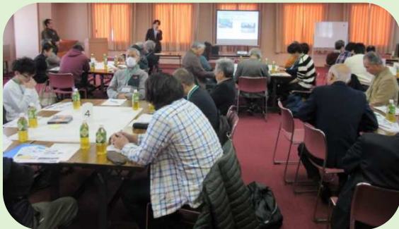
えべつ地域活動運営セミナー