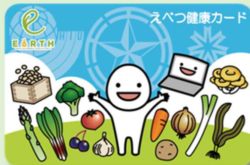
えべつ健康カード（食の臨床試験）