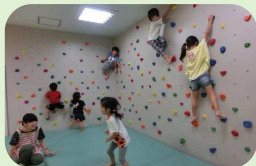
「ぼこ あ ぼこ」クライミングウォール