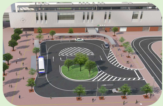
野幌駅前南口広場完成イメージ図