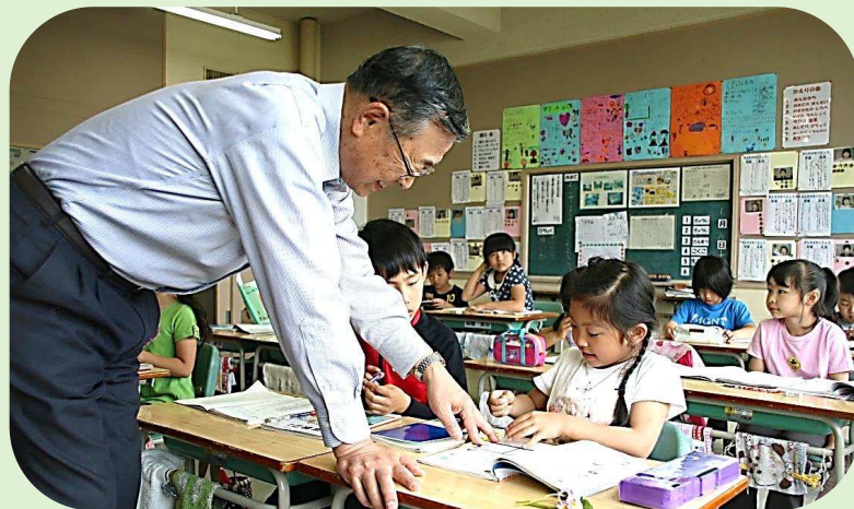
退職教員による補充的学習