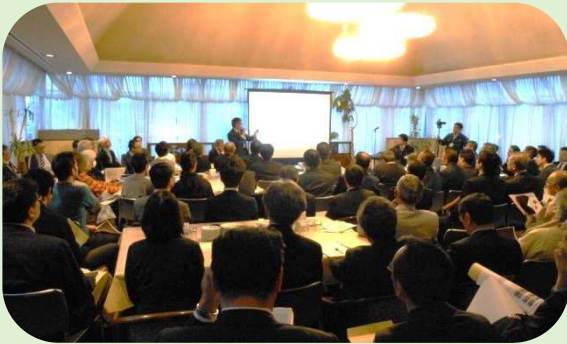
江別経済ネットワーク例会