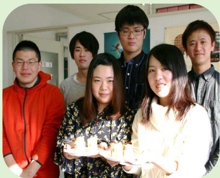
学生地域活動支援事業（江別産品を使ったスイーツ開発）