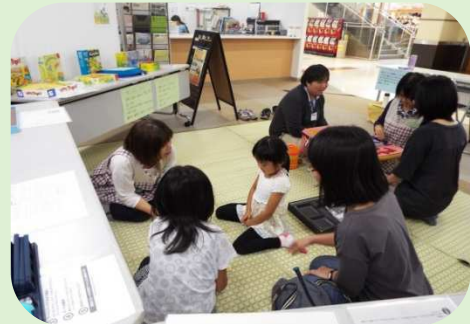
江別市民活動見本市