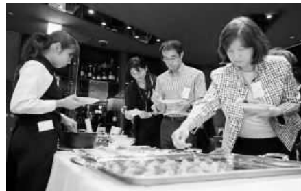
首都圏企業へのPR事業