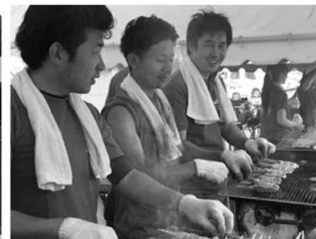
夏祭りボランティアの様子