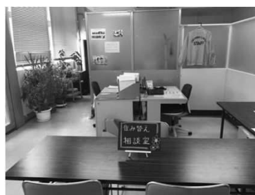
住み替え相談窓口