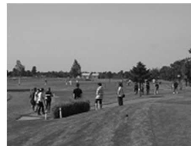
パークゴルフイベント