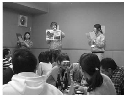
イベントで江別をPR

少子高齢化が加速する中、晩婚化・晩産化の解消に向け、行政としても若い世代へ出会いの機会を提供するとともに、江別市をPRし、交流人口を増加させることを目指し事業を開始