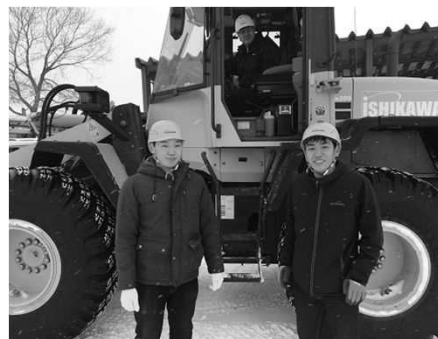
企業インターンシップの様子

当市では大学卒業後に市内企業等へ就職する者が少なく、札幌市などへの流出が顕著である。このため、約1万人の学生が在学している地域特性を生かして、空知管内7自治体や市内関係団体と協議会を立ち上げ、学生の地域への定着を目指して、学生と地域活動とのマッチング支援に関する本事業を開始