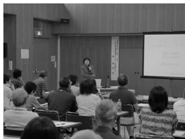
住み替えセミナー

人口減少問題への取組が喫緊の課題である中、まち・ひと・しごと創生総合戦略における人口減少対策として多世代による同居・近居、並びに多子世帯への住宅取得等の支援を実施する事により、定住化（転出抑制・転入促進）を促進