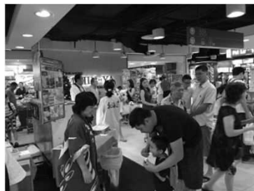
シンガポール江別フェア

平成23年に札幌市・江別市・帯広市・十勝管内18町村・函館市が総合特別区域法に基づく国際戦略総合特別区域に指定された。「札幌・江別エリア」は、「食品の安全性・有用性の分析評価と研究開発の拠点」の位置付けであるため、企業誘致推進事業の一環として立地環境整備支援を行い、食関連企業の集積を図る