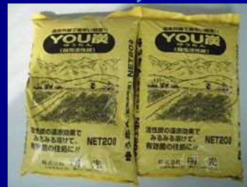
融雪剤の原料として再利用