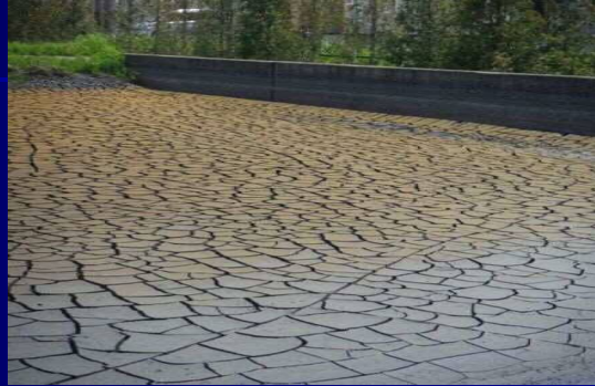
天日乾燥床の汚泥