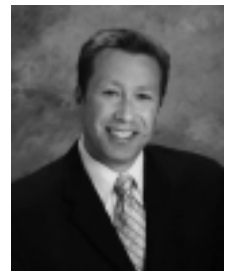
グレシヤム市 シェーン・ビーマス市長