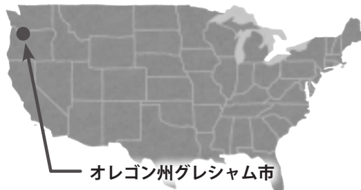
オレゴン州グレシヤム市

11月5日(日)から11月10日(金)に一般公募で集まった9名の市民と、江別市長など総勢18名の訪問団がグレシヤム市を訪問します。