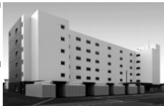
☎ 建築住宅課 ☎ 381・1041

られていた「新栄団地C棟」が11月に完成します。新しい団地は太陽光発電を導入(発電は共用部に使用)し、二酸化炭素の排出量の削減や災害時の電力確保など、環境や災害対応に配慮した設計です。完成後は現在新栄団地にお住まいの方が転居し、空き室が出た場合には広報えべつ11月号で新規入居者を募集。