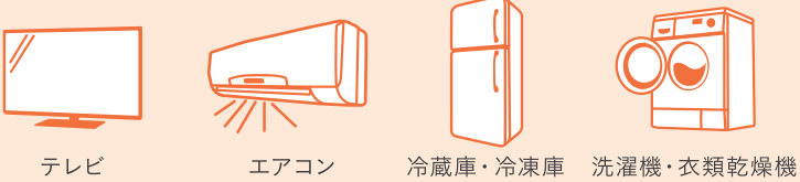
テレビ エアコン 冷蔵庫・冷凍庫 洗濯機・衣類乾燥機

これらの家電は、これまでどおり「家電リサイクル法」に基づき家電小売店などにより引き取られます。詳しく知りたい方は、お住まいの市区町村や家電小売店にお尋ねください。