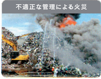
不適正な管理による火災

環境対策を行わずに廃家電を破壊することで、フロンガスや鉛などの有害物質が環境中に放出されます。