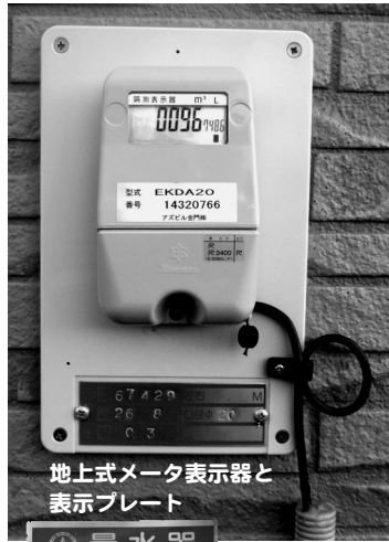
地上式メータ表示器と表示プレート