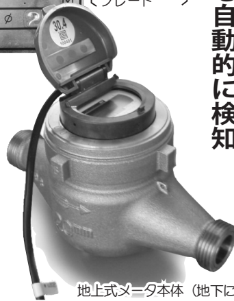
地上式メータ本体（地下に設置）