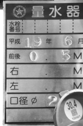
←地下式メータの表示プレート 平成19年6月にメータを設置した表示プレート