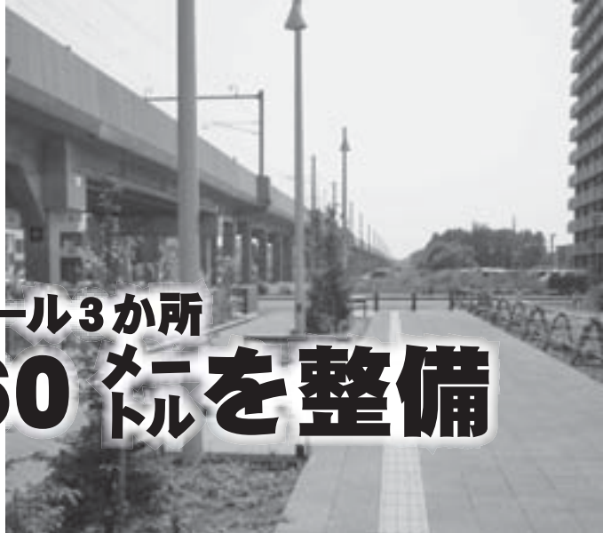
昨年度整備された東西グリーンモール