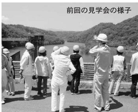
前回の見学会の様子

公共交通機関をご利用ください。水道庁舎には駐車できません。 ▽定員 80人(先着)。 ▽参加料 無料。各自、昼食をご用意ください。現地の公園で昼食を取る際の敷物を持参すると便利です。車内での飲物は用意します。 ▽申込方法 6月2日(水)～11日(金)の間に電話で住所、氏名、電話番号、希望の集合(乗車)場所を水道部総務課(☎385-1213または☎385-1214)へご連絡ください。団体での申し込みはできません。集合場所は、後日調整する場合があります。